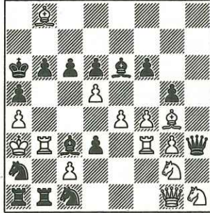
461 - B. Lurje et N. Plaksine U.R.S.S. (inédit)

14 + 15 Mat réflexe en 1 coup. a) Diagramme. b) Déplacer le Pd3 en d2.