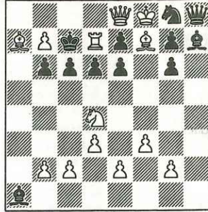
462 - F. Fatchullin et N. Plaksine U.R.S.S. (inédit)

14 + 15 Mat réflexe en 1 coup. a) Diagramme. b) Déplacer le Pd3 en d2.