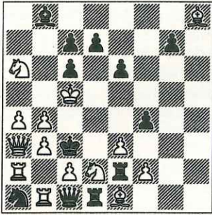
580 – P. Wassong France (Inédit) Dédié à Babette