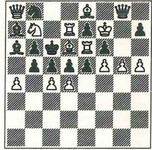
583 – A. Frolkine Ukraine (Inédit)